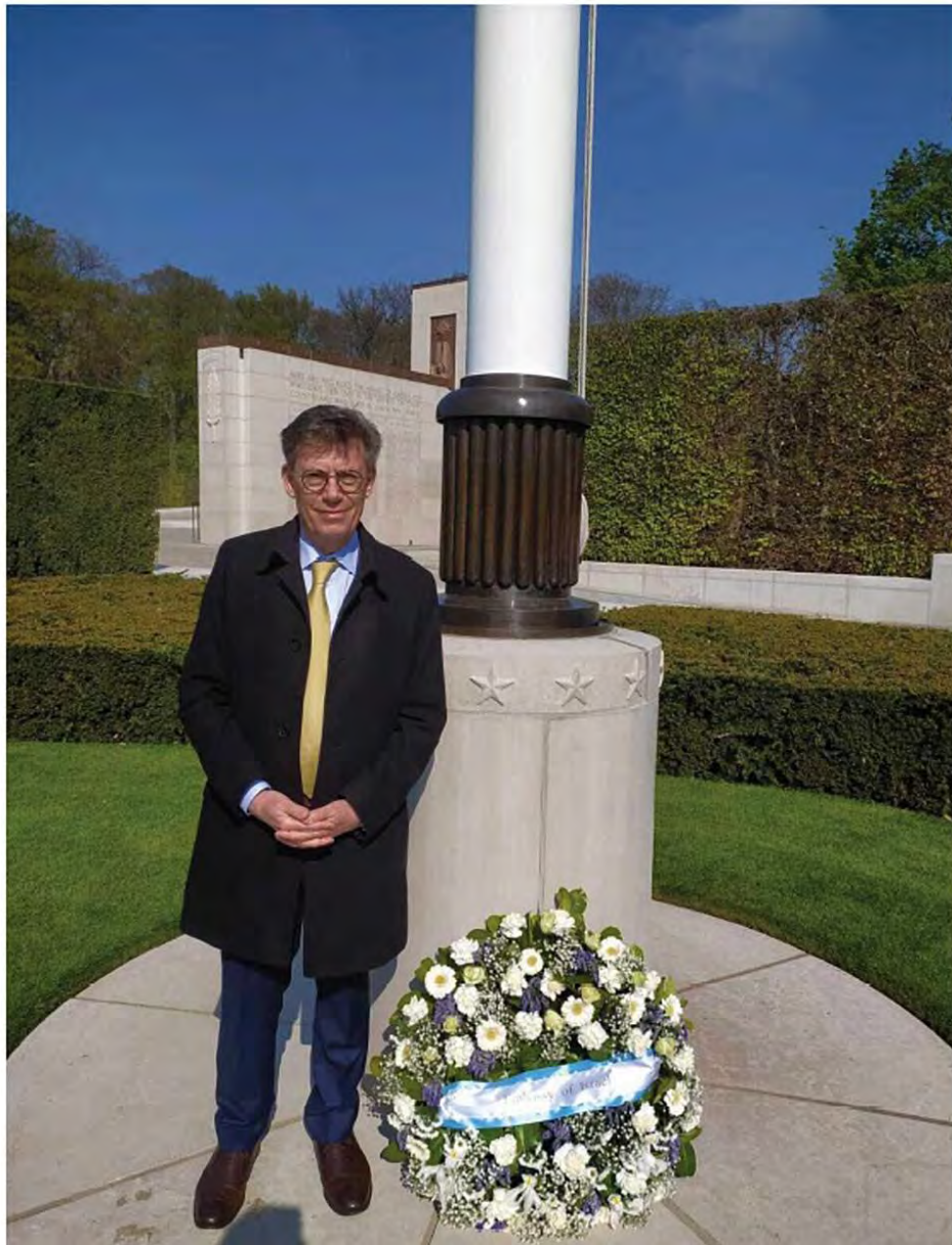
השגריר עמנואל נחשון מניח זר ליד קבר החייל היהודי

במסגרת פעילות הארגון, הוחלפו מצבות מעל קברי יהודים בבתי עלמין צבאיים אמריקניים בנורמנדי בצרפת, במנילה בירת הפיליפינים, בבלגיה, בלוקסמבורג ובארה"ב עצמה. בין השאר, הוחלפו צלבים במגיני דוד מעל קבריהם של שני אחים טייסים שנהרגו בפער של כמה חודשים – האחד נקבר בנורמנדי, והשני בבית העלמין האמריקני בבלגיה. בפברואר 2020 התקיים טקס בבית העלמין במנילה, שבו הוחלפו חמש מצבות של חיילים יהודים.