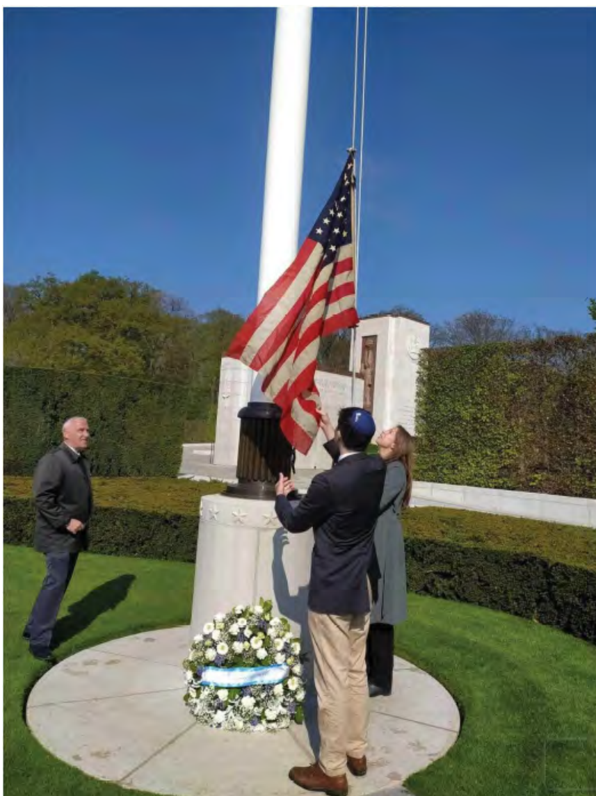
במקום הונף דגל ארה"ב המקורי שניתן למשפחה בטקס ההלוויה, ובו 48 כוכבים בלבד