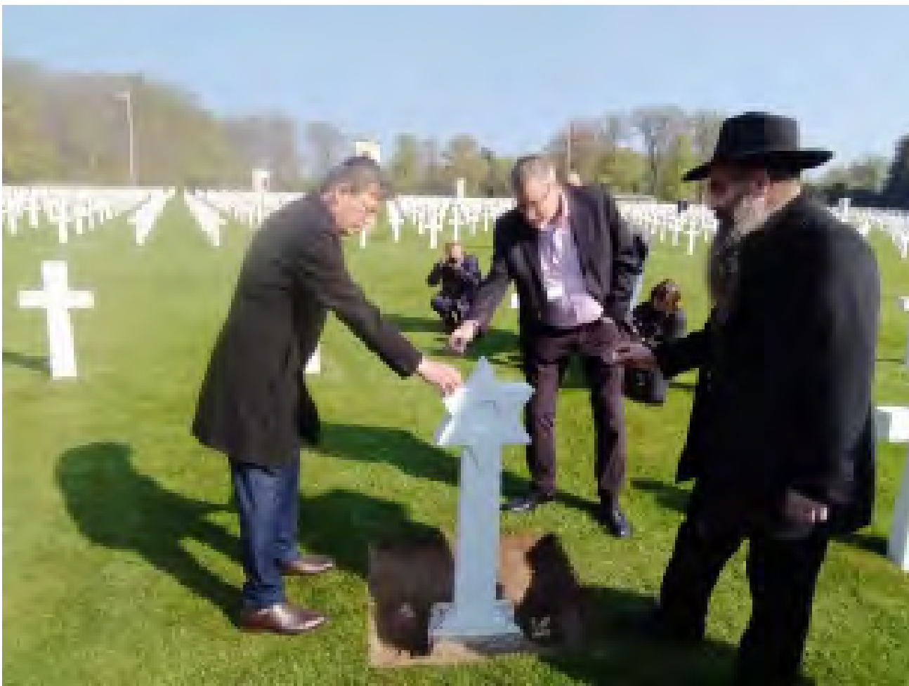
שגריר ישראל בבליגיה ובלוקסמבורג, עמנואל נחשון (משמאל), ליד המצבה החדשה (צילום: מבצע בנימין)

עד היום הוחלפו 19 צלבים מעל קברים של חיילים וחיילות יהודים אמריקנים. פרויקט החלפת הצלב במגן דוד מתחיל באיתור שמות יהודיים בבתי עלמין צבאיים אמריקניים ברחבי העולם, ולאחר מכן פותח בחקירה גנאלוגית שמוצלבת ברשימת המהגרים היהודים שהגיעו לארה"ב. לאחר שעולה האפשרות שמדובר בחייל יהודי, הארגון פונה למשפחה ומבקש את הסכמתה לשינוי במצבה.